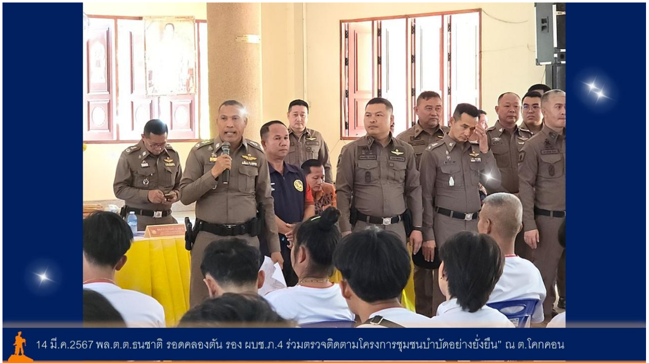
14 มี.ค.2567 พล.ต.ต.ธนาชาติ รอดคลองตัน รอง ผบช.ภ.4 ร่วมตรวจติดตามโครงการชุมชนบ้ำบ้ด้อย่างยั้งยั้ง" ณ ต.โคกคอน