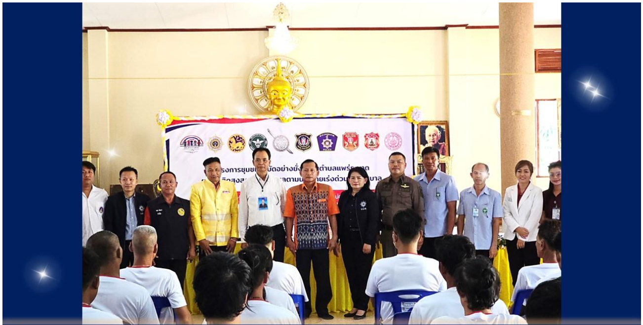
14 มี.ค.2567 โครงการชุมชนบำบัดอย่างยั่งยืน” ณ ต.โคกคอน