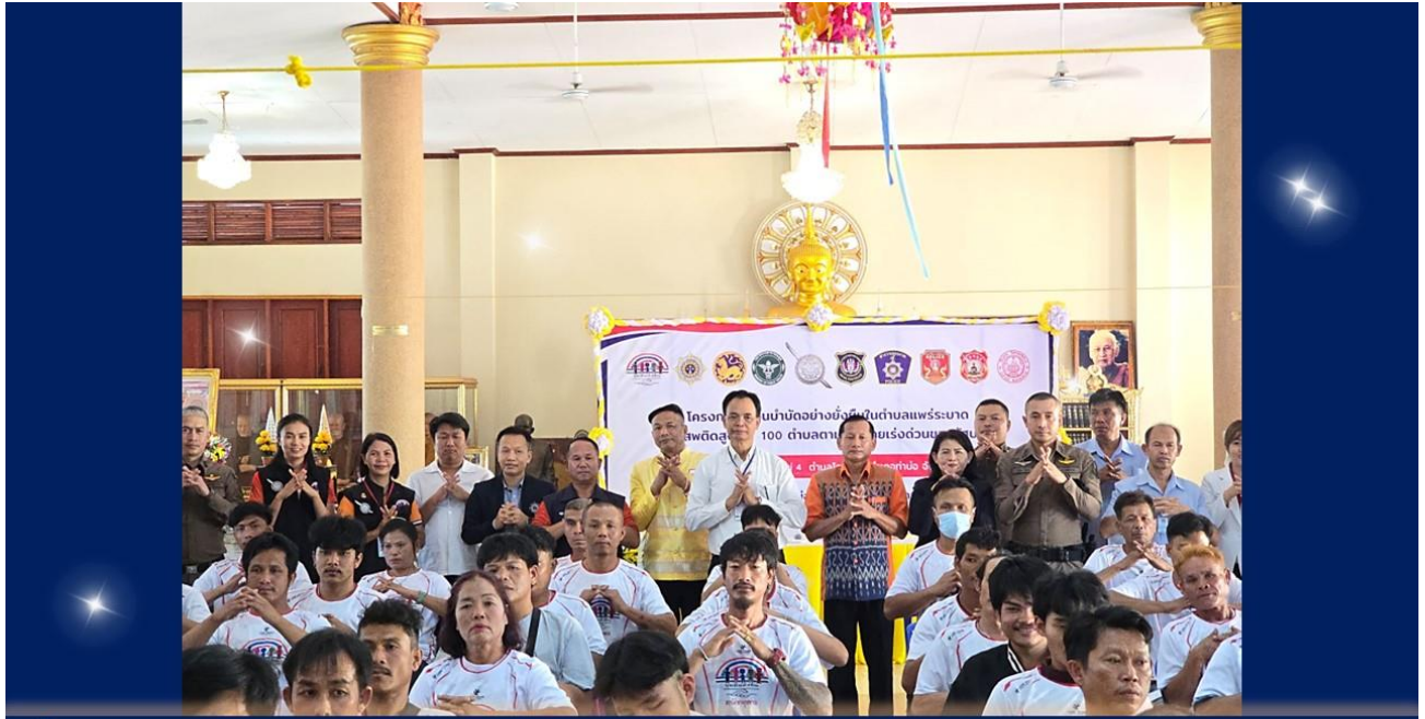
14 มี.ค.2567 โครงการชุมชนบำบัดอย่างยั่งยืน” ณ ต.โคกคอน