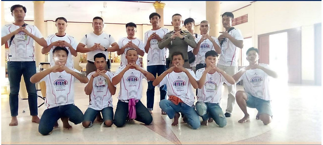
14 มี.ค.2567 กลุ่มผู้เข้าร่วมโครงการชุมชนบำบัดอย่างยั่งยืน” ตำบลโคกคอน