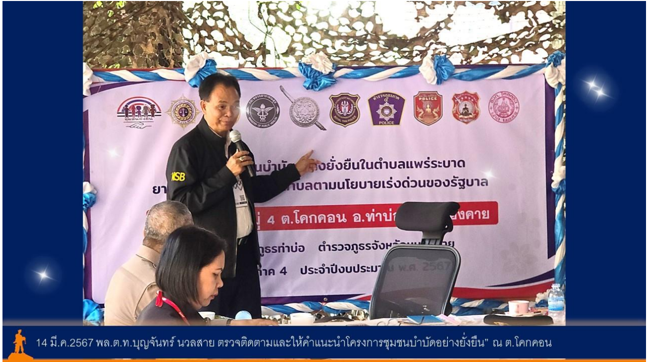
14 มี.ค.2567 พล.ต.ท.บุญจันทร์ นวลสาย ตรวจสอบและให้คำแนะนำโครงการชุมชนบ้ำบ้ด้อย่างยั้งยั้ง" ณ ต.โคกคอน